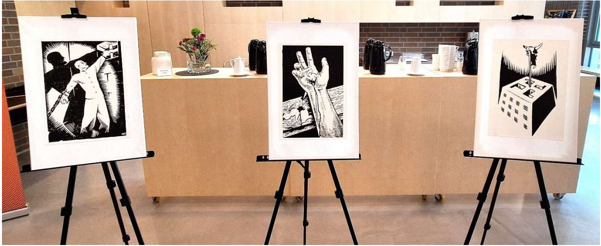
Bilder gegen den Nationalsozialismus