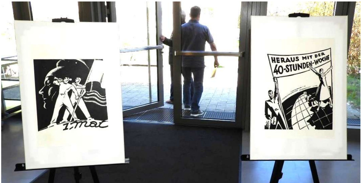
Bilder zum 1. Mai